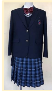
現行の堅田中学校の制服