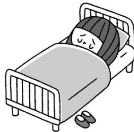
具合が悪いとき 一時的に休養できる