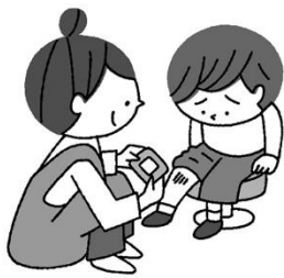
ケガをしたとき 救急処置してもらえる