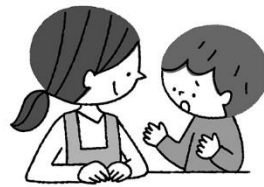
悩みがあるとき 相談できる