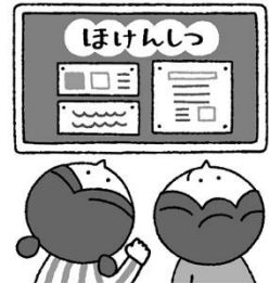
健康について 知りたいとき