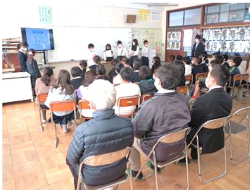
5年 防災学習発表会 12/1