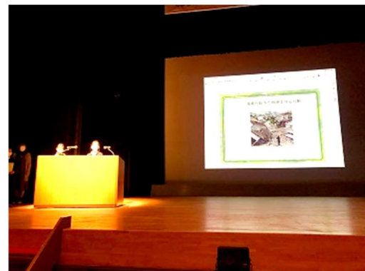
堅田のWAを考える市民の集い 12/25