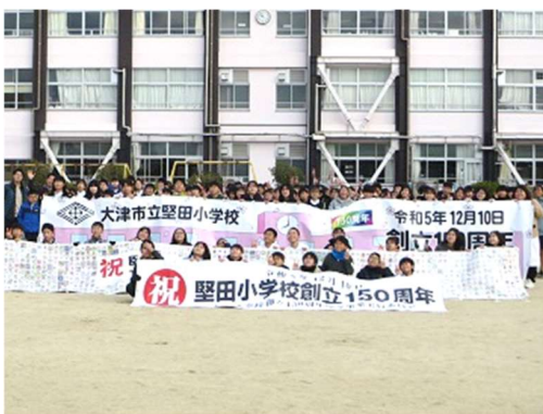
創立150周年横断幕お披露目 12/7