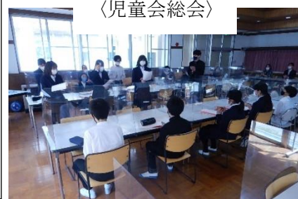
〈生徒会オリエンテーション〉

ぎながら、先生と一緒にあって葛川を盛り上げている姿をたのもしく感じています。私は皆さんとの葛川での出会いをすばらしいものにしていきたいと思いますので、1年間どうぞよろしく願いたします。