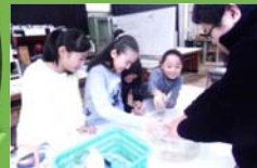
小学6年の理科、気体の性質を調べる実験中です。中学校の先生が教えます。