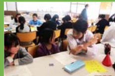
中学生が小学生に考えるヒントを伝えています。