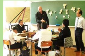
中学生オールイングリッシュの英語授業