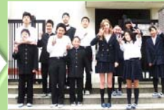
オーストラリアのジンダーバイン・セントラル・スクールと交流予定です。