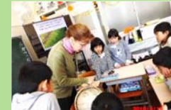
地域在住の外国人の方から海外の生活、文化等を学びます。

大津市立葛川小・中学校は 琵琶湖に注ぐ安曇川の上流にある山あいの小さな学校です。 現在は、葛川学区と、そこに隣接する久多地区（京都市）の子どもが通っています。 （平成29年6月現在小学生14名、中学生11名が在籍）