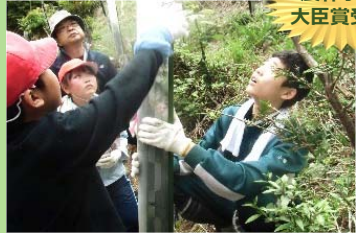
農林水産大臣賞受賞

【学校林活動】杉の木を保護する活動などに取り組んでいます。全日本学校関係緑化コンクール学校林等活動の部で以下の賞を受賞しました。 平25.5.26 国土緑化推進機構会長賞 平29.5.28 農林水産大臣賞