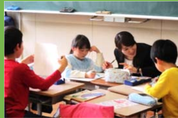
一人一人に合わせて、学習の目標を決め、わかるまで教えます。

【学校林活動】杉の木を保護する活動などに取り組んでいます。全日本学校関係緑化コンクール学校林等活動の部で以下の賞を受賞しました。 平25.5.26 国土緑化推進機構会長賞 平29.5.28 農林水産大臣賞