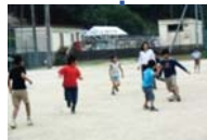
休み時間の全校遊び 小・中学生同士や先生との触れ合い