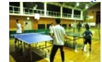
部活動 体育館を広く使えます