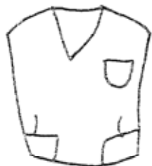
チャック 左脇あき(全部)

学校指定メーカーの学生服による。(華紺ダブル背広型) 替ボタン、ネクタイ、リボンは学校購買部に備えつける。