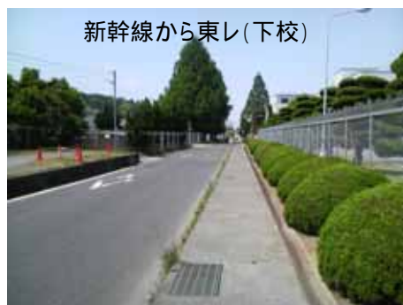
新幹線から東レ(下校)