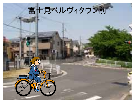
富士見ベルヴィタウン前