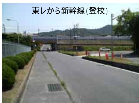
東レから新幹線(登校)

先日、本校の生徒が自転車で下校中、対向してきた車と接触する事故が起きました。後続車がなかったのと、その生徒がヘルメットをかぶっていたので、幸いにも軽傷で済んだのですが、少し間違えば大事故につながっていました。また、狭い道を3、4人が横に広がって歩いたり、信号を守らなかったり、地域の方が困っておられると聞きます。自分たちだけの道路ではありません。社会の一員として、交通ルールをきちんと守る責任を果たしてほしいと思います。