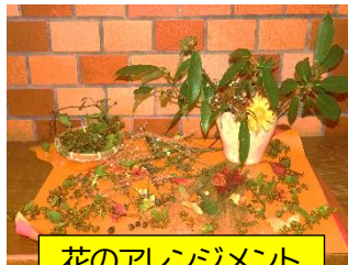
花のアレンジメント