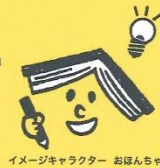
イメージキャラクター おぼんちゃん

「読書感想文をどうやって書いたらいいかわからない」 「どんな本を読んだらいいかわからない」 そんな声にお答えします。 さあ、読書感想文にチャレンジしよう!