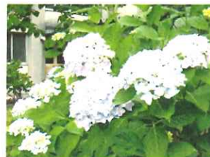
今年もアジサイが咲きました

6月下旬からは、梅雨らしい天候が続きました。蒸し暑い日も多く、体調を崩しやすい時期ですが、熱中症になる子どもたちも今のところは出ていません。ただし、この後も本格的な夏を迎えますので、体育、部活動の学校生活だけでなく、家庭生活でも水分補給や睡眠時間を確保するなどの対策を忘れず、熱中症にならないよう家族みんなで気をつけてください。