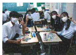
ビッグアート色塗り