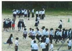
昼休みの大縄の練習