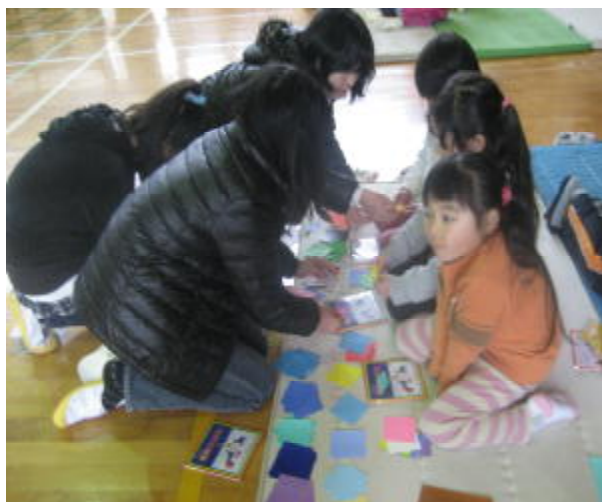
体育館での交流（折り紙） ↑

石山小学校の5年生は毎年、石山学区の保育園や幼稚園の年長組さんと交流をしています。1月26日には、石山幼稚園の園児さんを本校に招いて、ドッジボールやけん玉、大なわなどのいろいろな遊びで交流をしました。その後には、一緒に給食を食べました。2月には、新石山寺保育園や大平保育園、保育の家しょうなんとも交流を計画しています。