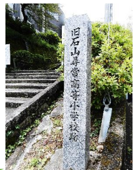
旧石山尋常高等小学校跡(現石山寺こども園)

明治30年、寺辺にある石山学校は『石山尋常高等小学校』となりました。尋常高等小学校というのは、尋常小学校(4年間)と高等小学校(4年間)の両方を1つの学校の中に置く学校のことです。場所は今の『石山寺こども園』のところにありました。近くには、3年生までの鳥居川分教場(晴嵐学区)と赤尾分教場(南郷学区)があり、寺辺北に住んでいる子どもたちは、3年生までは鳥居川分教場まで通っていたそうです。「道がせまくて、雨の日は道が川のようになりびしょぬれになったけれど、それでも水の中を走っていくのが楽しかった。」と当時小学生だった方が書き残しておられます。また、「遠い道を帰る途中、三日月楼の旅館で焼くウナギのかば焼きの香りをかぎながら帰った。」という思い出話も残しておられます。