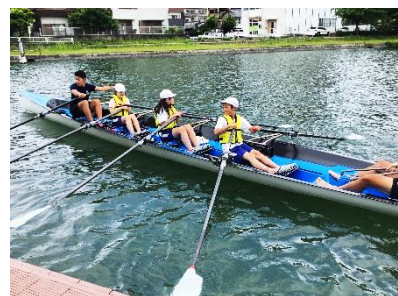
5年 琵琶湖環境学習(唐橋)

これから本格的な梅雨を迎え、蒸し暑さや外遊びができないことなどから心身の調子もくずしがちとなります。また、水泳学習も始まります。心身ともに元気に過ごせますようご家庭でも健康管理をよろしく願います。