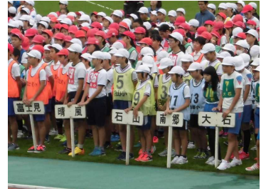
10月17日 市陸上記録会

読みかけのページに葉の代わりにイチヨウの葉をはさむとよいそうです。木から出来た紙は、小さな虫の好物です。それがつくと大事な本が食べられてしまいます。しかし、イチヨウの葉をはさんでくと虫がつかないのだそうです。ご存じのようにイチヨウの実は銀杏ですが、10月17日 市陸上記録会 その銀杏が落ちる頃になると、実の周りの柔らかい部分が腐ってきて、すごくくさいにおいがします。学校の通用門付近にもイチヨウの木がたくさんあり、この時期、たくさん落ちていています。腐った部分を直に触ると、手や肌がかぶれることがあります。そのかぶれのもとになるものが、すごいにおいを出している「イチヨウ酸」という名前の成分だそうです。それは、葉にも含まれていて、そのにおいを嫌って虫がつかないそうです。1枚挿んでおくだけで、ぶ厚い本でもそのにおいが届くので大丈夫なのだそうです。読書に適した秋の夜長です。せつかくの機会ですので、そのイチヨウの葉を葉に使いながら「親子での読書」を楽しんでみてはいかがでしょうか。