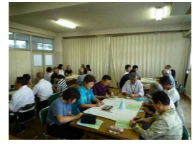
コミュニティスクール拡大委員会