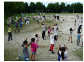
夏休みラジオ体操