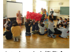
トンちゃん人権集会