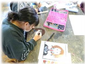
ものづくりクラブ