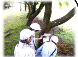
サーチ・ザ・ツリー

葛川少年自然の家に行き、アマゴつかみ、スプーン作り、サーチ・ザ・ツリーを行いました。子どもたちはそれぞれの活動に一生懸命、取り組んでいました。