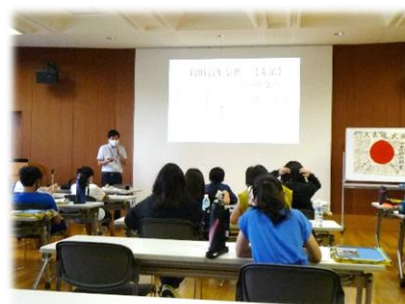
滋賀県平和祈念館での講演

当初は広島方面への修学旅行(11月)を予定していましたが、行き先を奈良・滋賀方面に変更し、予定を早めて9月に実施しました。