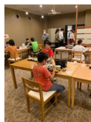
← おごと温泉で宿泊(夕食の様子)

当初は広島方面への修学旅行(11月)を予定していましたが、行き先を奈良・滋賀方面に変更し、予定を早めて9月に実施しました。