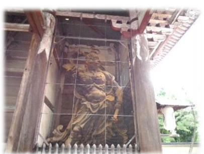
南大門の金剛力士像