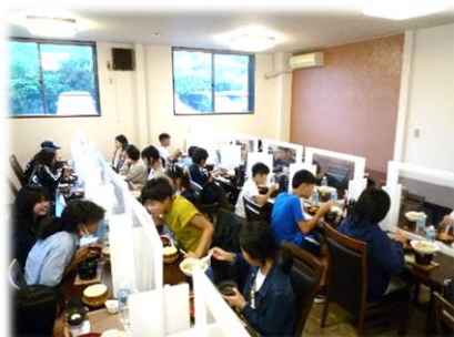
レストランで昼食