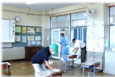
消毒作業に取り組む 地域の方

新型コロナウイルス感染防止のため、7月2日から放課後に、地域の方にボランティアとして普通教室・特別教室のドアや机・いす、校舎の階段の手すり等の消毒作業をしていただいています。8月末まで続けていただく予定です。皆さんが安全に学習できるように、汗いっばいになりながら、陰で支えていただいている地域の方に感謝の気持ちでいっぱいです。ありがとうございます。