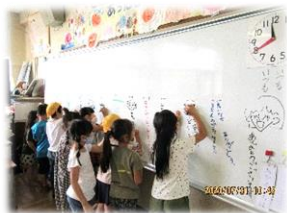
感謝の気持ちを伝える メッセージを書く 1年生