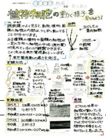
(6年生実験教室レポートより)