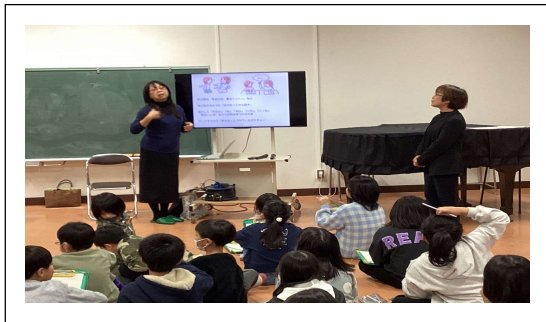
手話をまね 通じる喜び 感じたよ (4年)