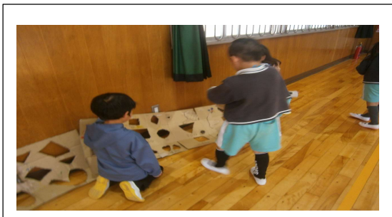
工夫して みんなで作った 秋祭り (1年)