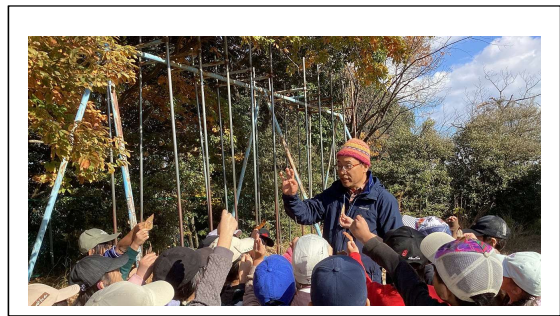
秋模様 ネイチャーゲームで自然満喫 (2年)