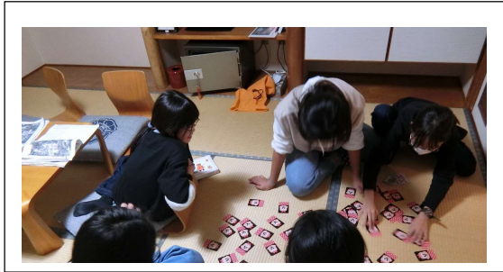
修学旅行 初めて過ごす 友との夜 (6年)