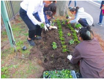
【夢づくりプロジェクト】