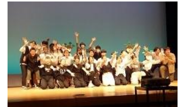
【生徒会のオープニング】

入学式、始業式、終業式、卒業式などはもちろん、他に校外学習、体育祭、文化祭などたくさんの行事があります。一年間の行事予定はP8の8. 年間行事予定のとおりです。