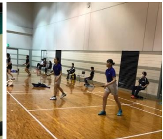
バドミントン女子 (野洲市総合体育館)