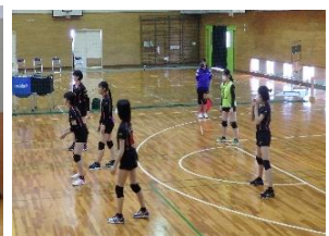
バレーボール女子 (栗津中学校)