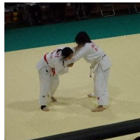
柔道女子 (県立武道館)

5月19日(木)、20日(金)に県内各地で大会が行われました。滋賀県の地域感染レベル2のため、今回も無観客で実施される事となり、保護者の皆様には応援を控えていただくことになり、大変残念でした。しかし、生徒たちは、限られた練習時間の中で練習してきた成果をしっかりと発揮してくれました。栗中生のパワーを感じました。