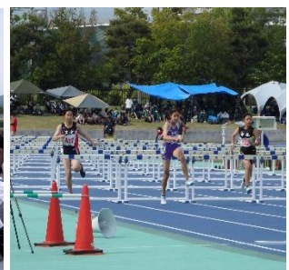
陸上 (皇子山陸上競技場)