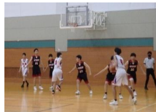
バスケットボール男子 (におの浜体育館)